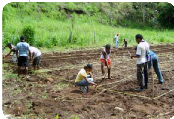
Studenten van de Stiper Landbouwhogeschool leggen nieuwe proefveldjes aan. Ze leren zo in de praktijk nieuwe gewassen te verbouwen en het land te bewerken.

De school wil vooral de Papua's uit het binnenland helpen om, binnen de context van de eigen tradities en leefregels, hun landbouwmethodes te moderniseren. Veel boerenfamilies in de bergen doen nog op dezelfde manier als hun ouders en grootouders aan akkerbouw en veeteelt. Migrantenboeren uit andere delen van Indonesië zijn succesvoller. Er dreigt daarom een tweedeling te ontstaan. Stiper wil aansluiten bij de behoeften van Papua. Met steun van Hapin kon Stiper vorig jaar de school aanzienlijk uitbouwen.