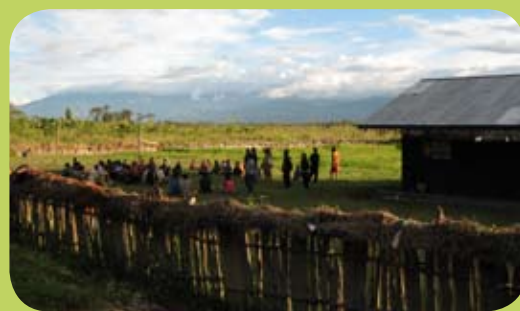
De leerlingen van de school in Kurulu wachten buiten op het begin van de les.

Veel Papua's hebben geen kansen gehad om naar school te gaan of haken voortijdig af omdat er geen geld meer is voor betaling van schoolgeld of uniform. Deze groep drop-outs in het dorpje Kurulu in de Baliemvallei, krijgt een nieuwe kans. Vrijwilligers sporen in de drie dorpen in de omgeving voortijdige schoolverlaters en analfabeten op en geven hen les in hun eigen taal. Dit volwassenonderwijs is een doorslaand succes. In 2007 haalden 175 leerlingen een diploma. Hapin steunde dit mooie project door bij te dragen in de salariskosten van de onderwijzers.