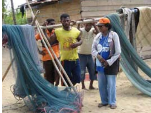
foto boven: nieuwe netten voor de vissers foto onder: één van de vluchtelingendorpen

In 2003 en 2004 keerden 63 gezinnen in twee groepen terug uit buurland Papua New Guinea, naar het land van hun voorouders in de regio Merauke. Hun ouders wilden na de overdracht van Nederlands Nieuw-Guinea in 1962 niet onder Indoneesisch bestuur leven. In PNG konden en mochten ze echter niet wortelen. Ze kenden het land van hun voorouders alleen uit de verhalen, maar keerden toch terug. Ze kregen een viertal dorpen toegewezen. Daar mogen ze, onder toezicht van nabijgelegen militaire posten, het omringende land bewerken. Hun aanspraken op het land van hun voorouders worden niet erkend. Naast dit dorp Nasem, waar 22 huizen staan, zijn er nog de dorpen Dalir, Tomer en Buti. Hapin heeft hier geholpen met de aankoop van visnetten voor de mannen en naaimateriaal waarvan de vrouwen noken (draagtassen) maken voor de verkoop.